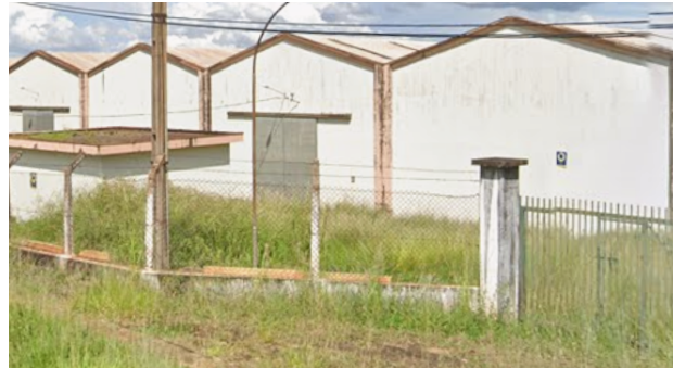
Imagem recente, 2024