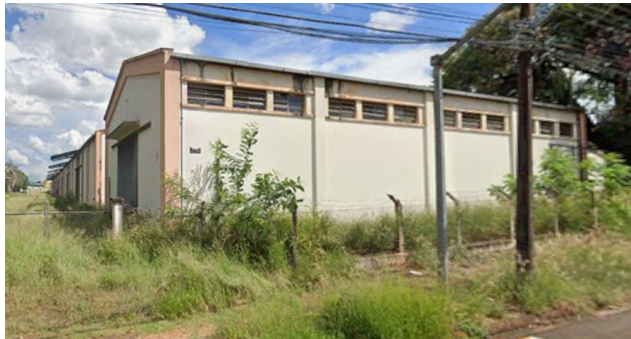
Imagem recente, 2024