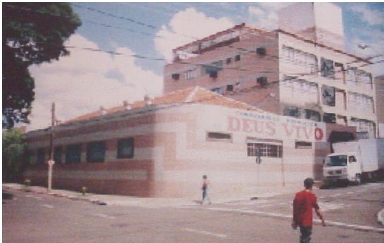
Fachada principal.