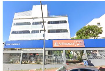
Fachadas atuais, 2025.