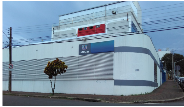
Fachada atualmente.