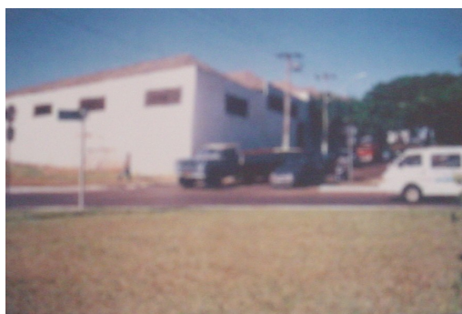
Vista geral do armazém.