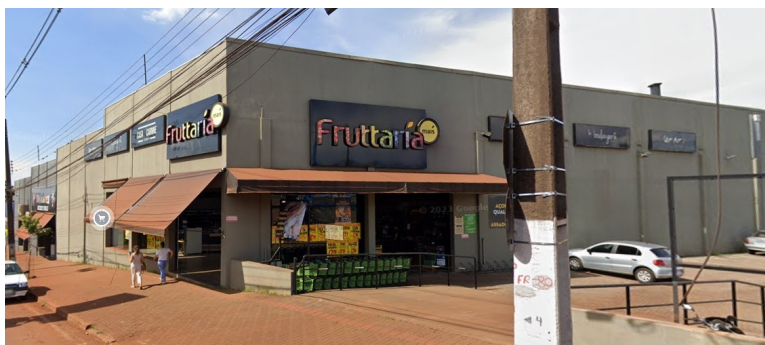
Fachada em 2023.