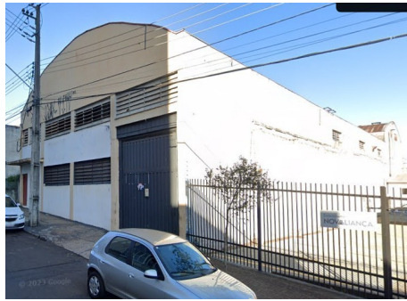
Vista geral em 2023.