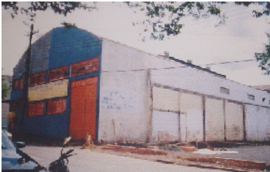
Vista geral do armazém.