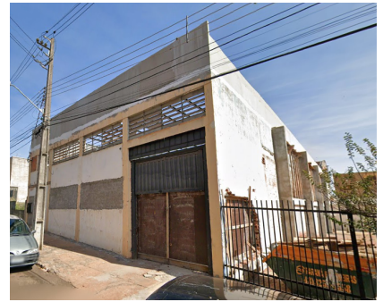
Vista geral em junho de 2025.