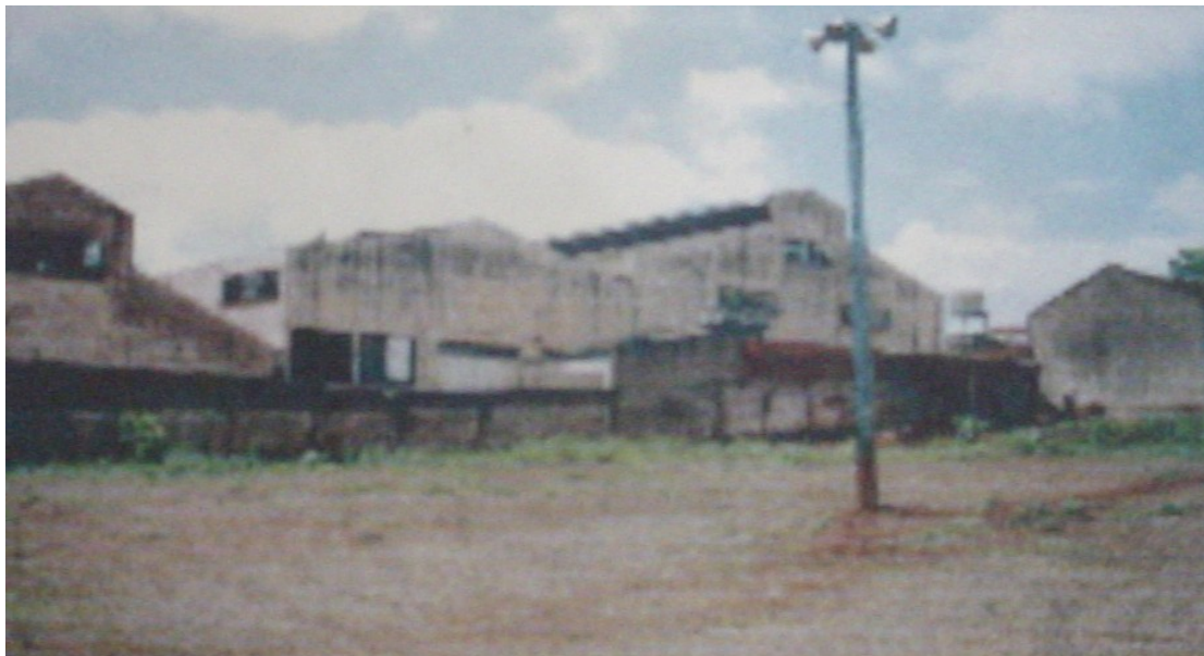
Vista dos fundos.