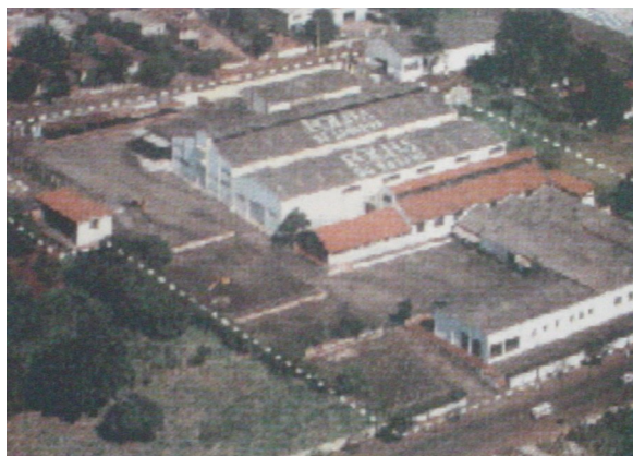
Vista geral do armazém.