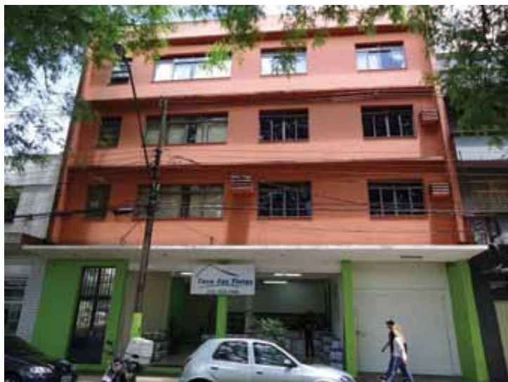
Edifício comercial em 2011