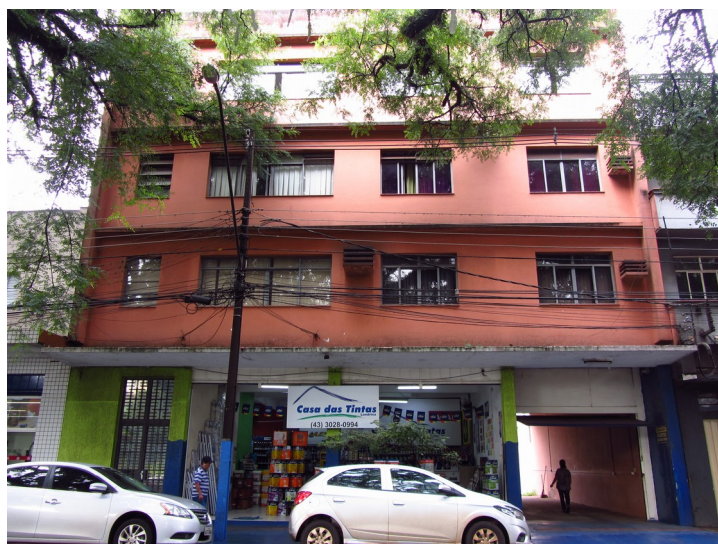
Edifício Comercial em 2018