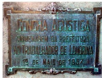
Vista do Monumento