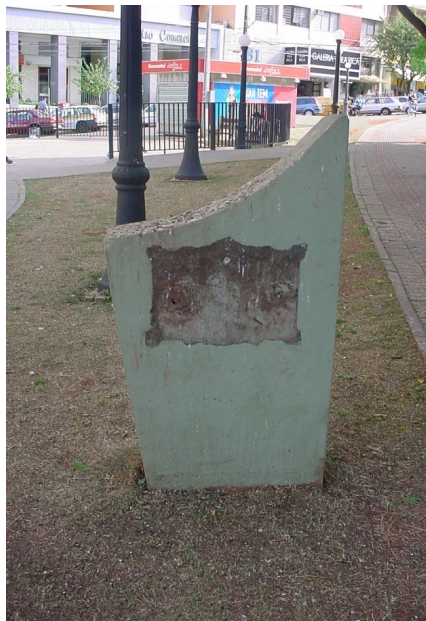
Vista Base sem a placa