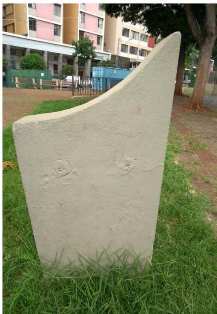
Vista Base sem a placa