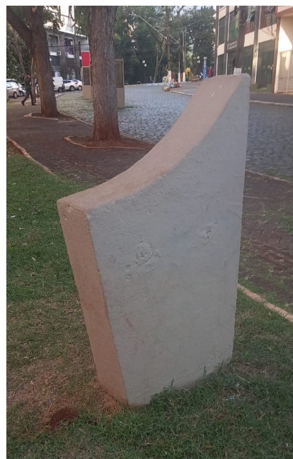
Vista Base sem a placa