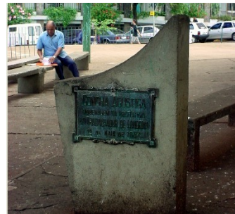
Vista da placa