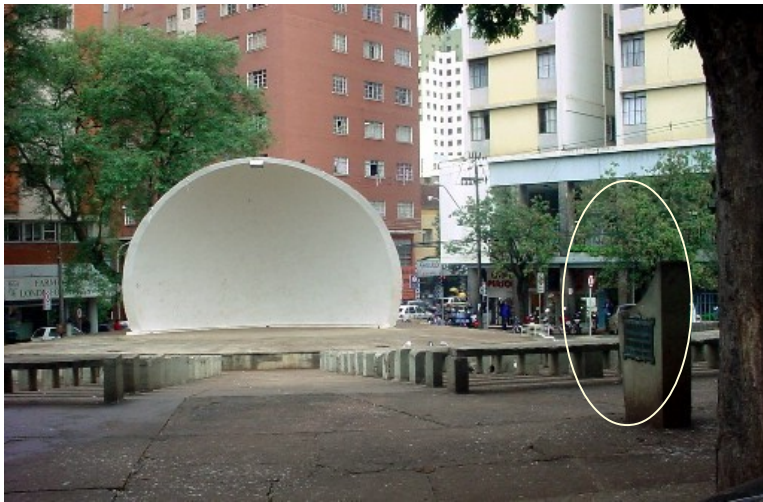
Praça Primeiro de Maio