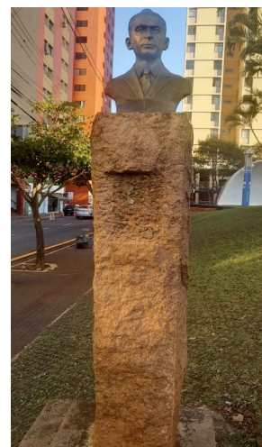
Busto de Abilon Souza Naves Fonte: Ana Gabriela T. 2023