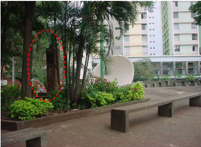
Praça Primeiro de Maio, antes da revitalização em 2007