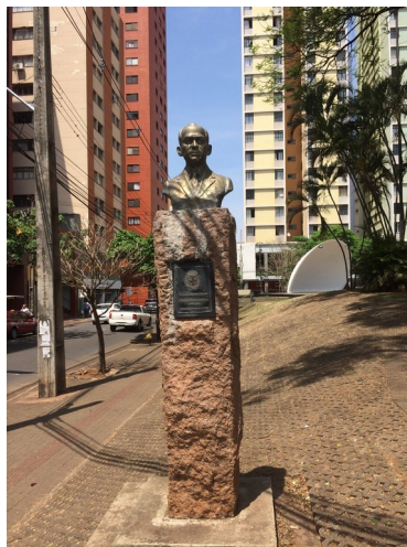
Busto de Abilon Souza Naves