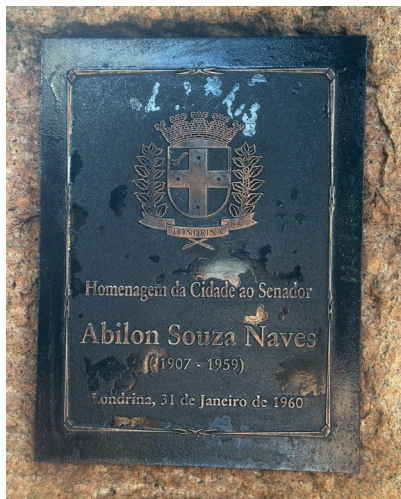
Placa Fonte: Dir. de Patrimônio Histórico, 2017