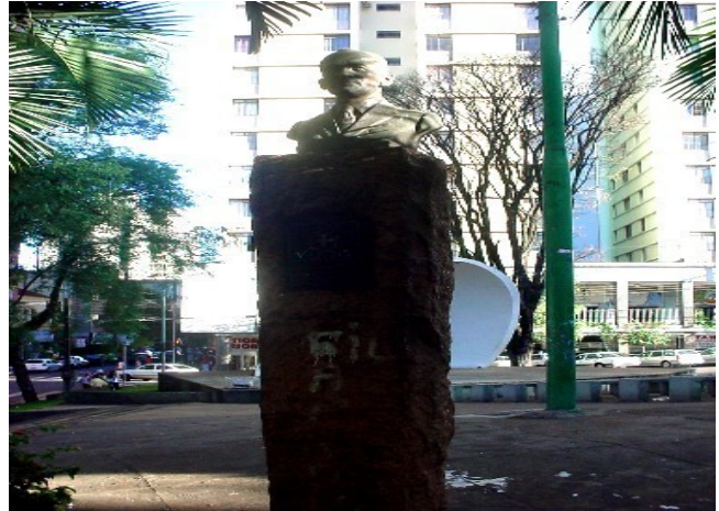
Vista frontal do Monumento