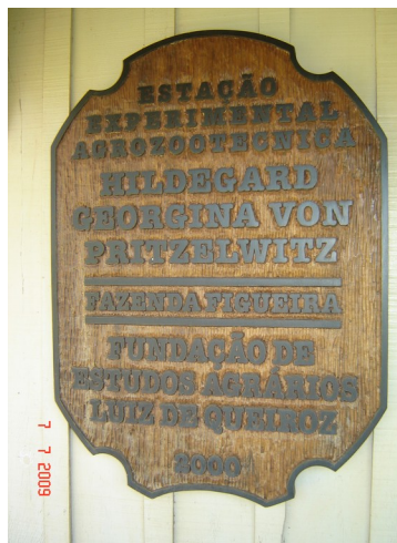
Placa Fonte: Secretaria Municipal do Ambiente

Mata do Barão - estação experimental agro zootécnica Hildegard Georgina Von Pritzelwit