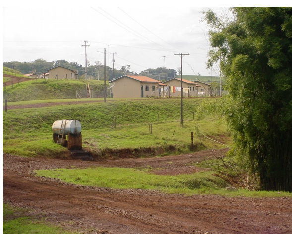
Colônia de Funcionários