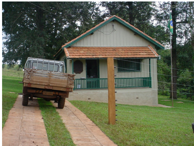
Vista do escritório da fazenda