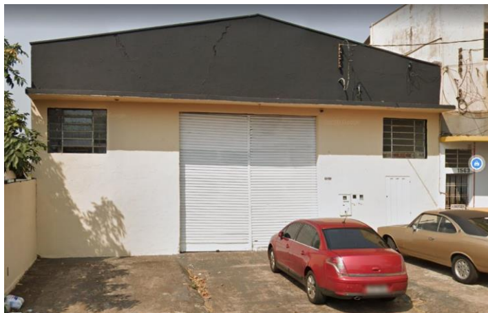
Google – set 2019