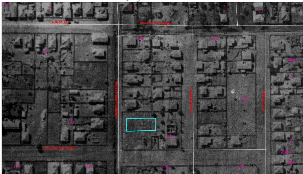
Av Jorge Casoni 1557