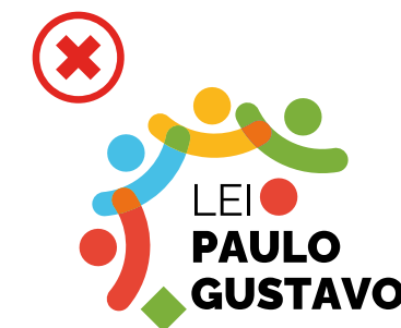
Não inserir elementos não previstos