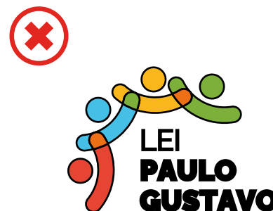
Não utilizar contornos