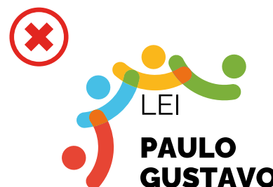
Não desalinhar os elementos