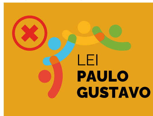
Exemplo de fundo proibido