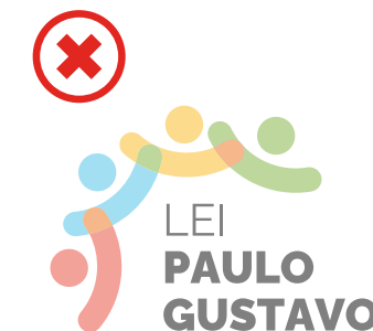
Não alterar a opacidade