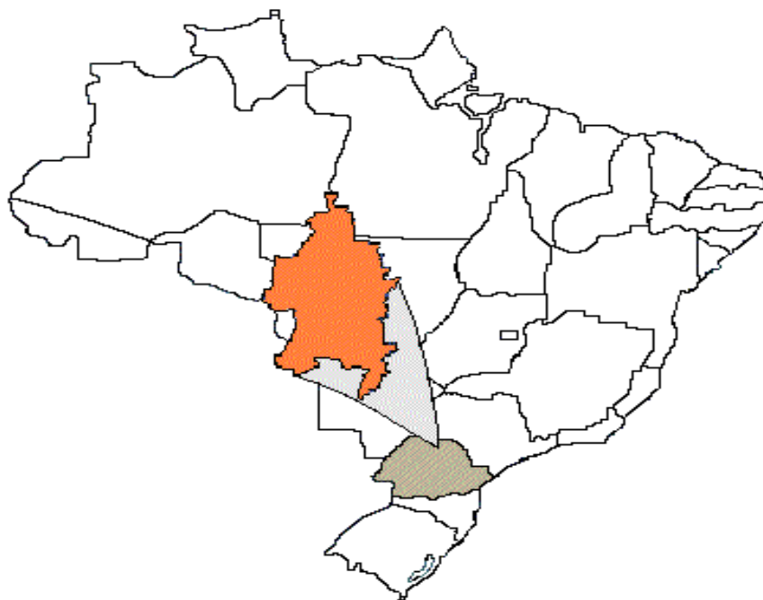
FIGURA 1 - MAPA DE LOCALIZAÇÃO DO MUNICÍPIO DE LONDRINA

O Município é constituído pelo Distrito Sede e mais os distritos de Lerroville, Warta, Irerê, Paiquerê, Maravilha, São Luiz, Guaravera e Espírito Santo, conforme figura a seguir: