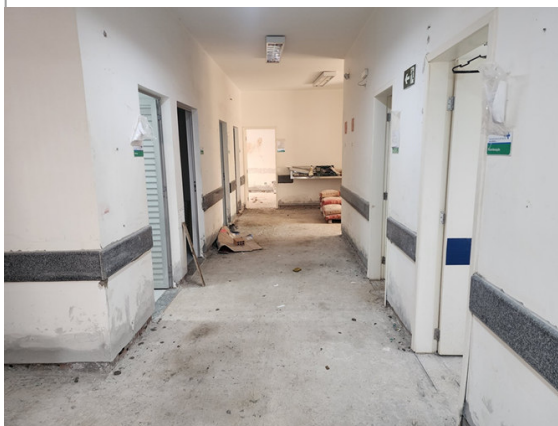
Reforma da UBS San Izidro em andamento