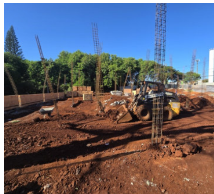
Construção PAM Leste Rua João Stringueta