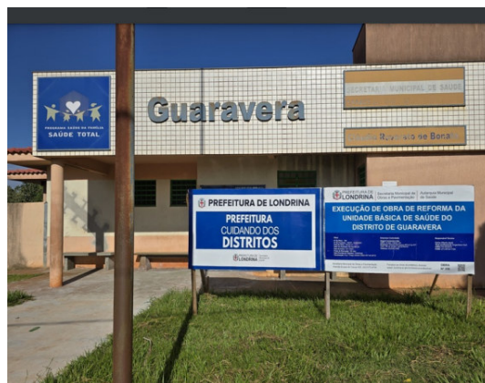
Reforma da UBS Guaravera em andamento