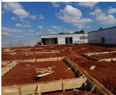
Construção PAM Norte Av. Saul Elkind