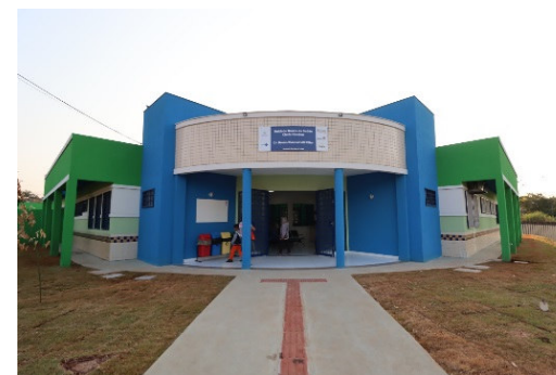
Reforma da UBS Chefe Newton Reabertura Oficial em 05/08/2024

Qual eixo do Plano Decenal dos Direitos da Criança e do Adolescente este projeto/atividade se relaciona?: