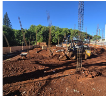
Construção PAM Leste Rua João Stringueta