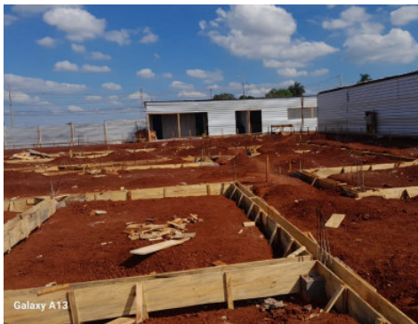
Construção PAM Norte Av. Saul Elkind