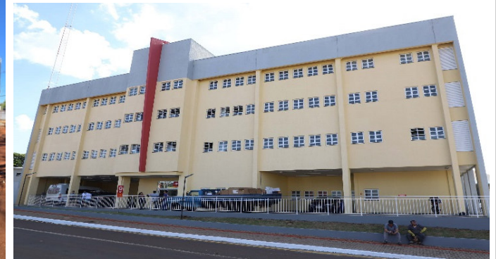
Concluídos os trâmites da SESA para pagamento de aditivos da obra do SAMU , inaugurado em 2023.