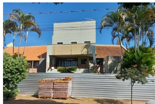
Ampliação e Reforma UBS Irerê Obra em andamento