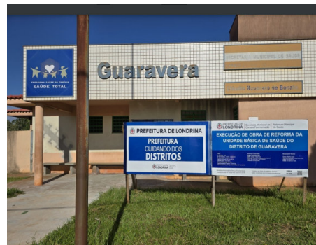
Reforma da UBS Guaravera em andamento