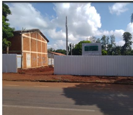
Construção PAM Sul Av. Guilherme de Almeida