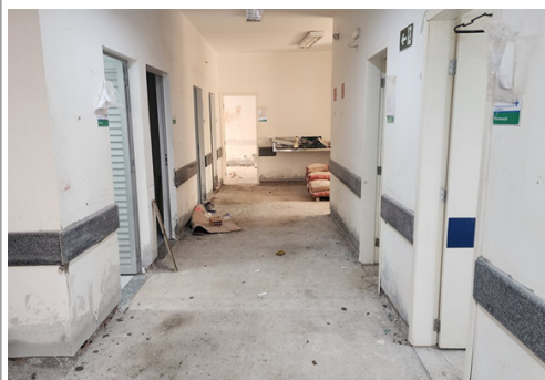
Reforma da UBS San Izidro em andamento