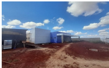
Construção PAM Norte