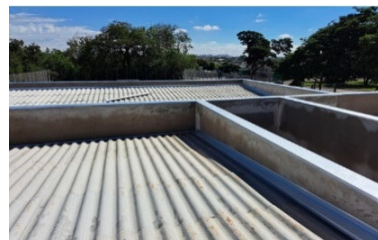
Construção PAM Sul