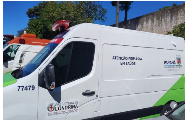
2 veículos tipo ambulância