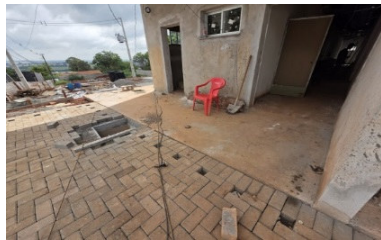
Construção PAM Leste