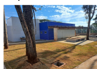
Construção PAM Sul