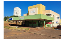
Iniciada obra de Reparo Estrutural da UPA Centro Oeste