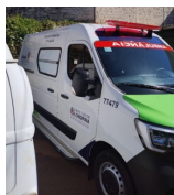
2 Veículos tipo ambulância