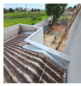
Execução Reforma UBSs Itapoã