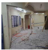
Execução Reforma da UBS Vila Ricardo