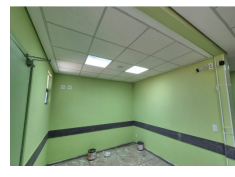
Execução da Ampliação e Reforma da UBS Irerê (retomada)