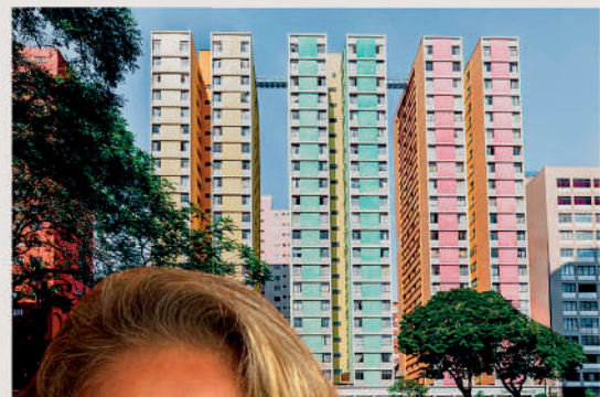
LONDRINA - PR - BRASIL