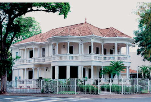
PALACETE DA FAMÍLIA GARCIA - LONDRINA / PR - BRASIL