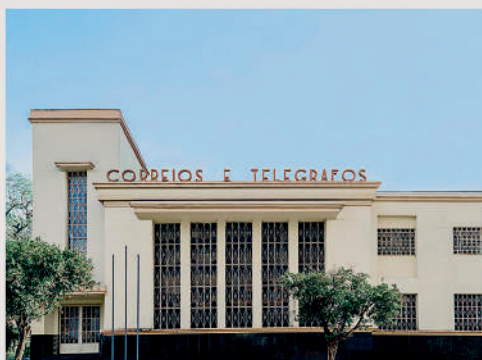
EMPRESA BRASILEIRA DE CORREIOS E TELEGRAFOS - LONDRINA - PR - BRASIL