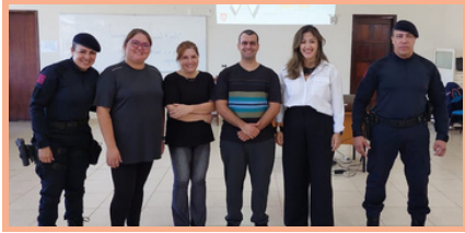
Plantão com RH