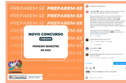
3 novos concursos públicos!