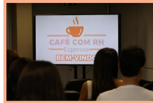
1º Café com RH Expresso!