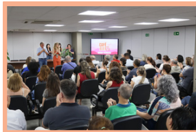
Café com RH Especial Mês do Servidor