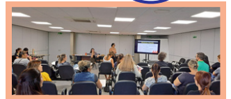
CAPACITAÇÃO Comunicação Não Violenta