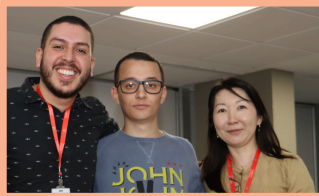
Café com RH